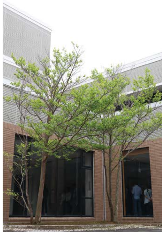
中庭のサラソウジュ