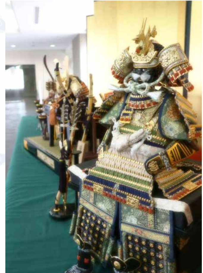
エントランス (5月12日まで端午の節句飾りを展示中)