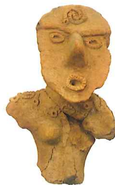
鹿嶋市片岡遺跡出土土偶