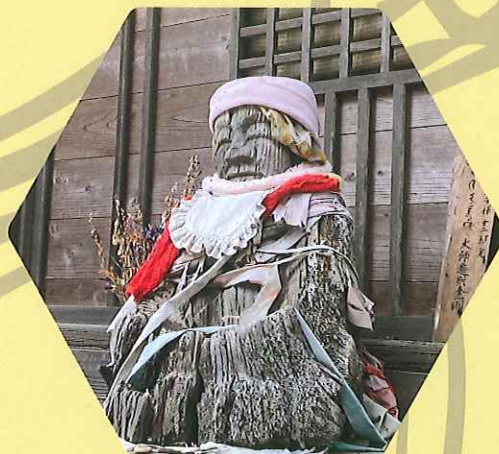
鹿嶋市栗生平光寺おびんづる様

ここでは、そうした祈りの形跡を辿りながら、近世に鹿嶋で生きた人々の祈りとそこに込められた願いを紹介します。